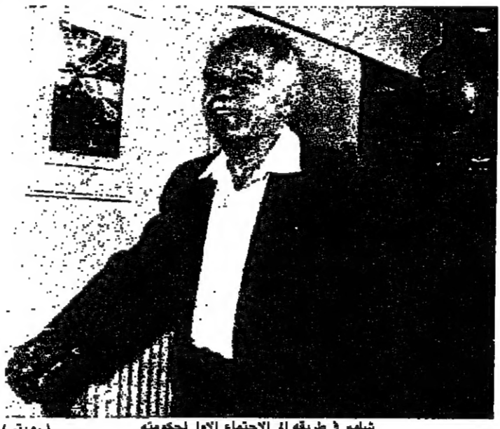
شامير في طريقه الى الاجتماع الأول لحكومته

أكد مسؤولون اسرائيليون أمس ان الحكومة العينية الجديدة، ستعلم من أجل أحال السلام في الشرق الأوسط ولكنها امتنعوا عن تحديد الدلائل التي ستعرضها بدلاً من الاقتراح الإسرائيلي الرامي الى إجراء محادثات مع الفلسطينيين في القاهرة. وقال وزراء في الحكومة العينية بعد أول اجتماع لها ان الحكومة لم تبحث اي خطوات جديدة لمنع الاندفاع الفلسطيني. ونفى النقيب روبينشتاين وزير شؤون مجلس الوزراء انباء صحفية ذكرت انه رفض صيغة وزير الخارجية الأمريكي جيمس بيكر بشأن عقد محادثات في القاهرة عندما اجتمع بمساعدي بيكر الأسبوع الماضي في واشنطن. وسئل وزير الصحة إيهود أولمرت هل يمكن لحكومة تعتمد على أحزاب يمينية تطالب بضم الأراضي المحتلة أن تدفع جهود السلام قدما بصورة أفضل من حكومة تضم حزب «العمل» فرفض قائلاً: «هذه الحكومة لديها القدرة على تنفيذ رأي واحد قوي وتنفيذه. وأنا متفائل جداً بأنه سيكون لدينا شجاعة كافية لنناقض تحت رئاسة [اسحق] شامير رغم ما يبدو للبحر من التعديل غير المرجح للمشركين في هذه الدعوة». وقد خصص الاجتماع الأول لبحث تدفق اليهود السوفيات عن اسرائيل وتقرير مكتب روبينشتاين عن الانضمام الى «العمل» وتلقى مكتب رئيس وزراء اسرائيل الكثير من المكالمات البولغونية من اسرائيل التي اعرب اصحابها عن أمل في إحلال السلام في الشرق الأوسط. ولكن لم يتصل مكتب أي من الزعماء العرب الذين دعمهم اسرائيل للاتصال بها. وقالت عملة تليفون ان حكومة شامير الجديدة تلتفت بشغف من مكالمات المحتمة وعدة مكالمات يدعو أصحابها الى السلام ولكن متحفظة باسم المكتب قالت انه لم ترد اي مكالمات من دول عربية.